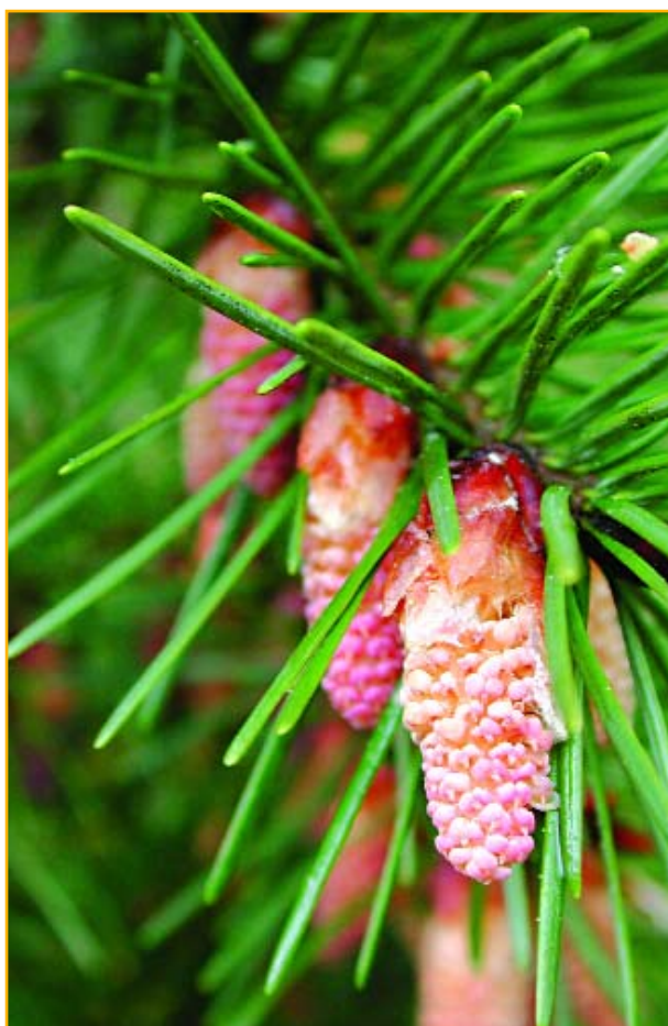
Floraison femelle sur pin maritime