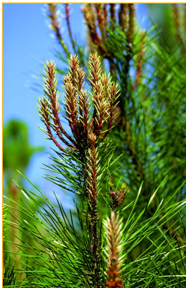
Nouvelle pousse sur pin maritime