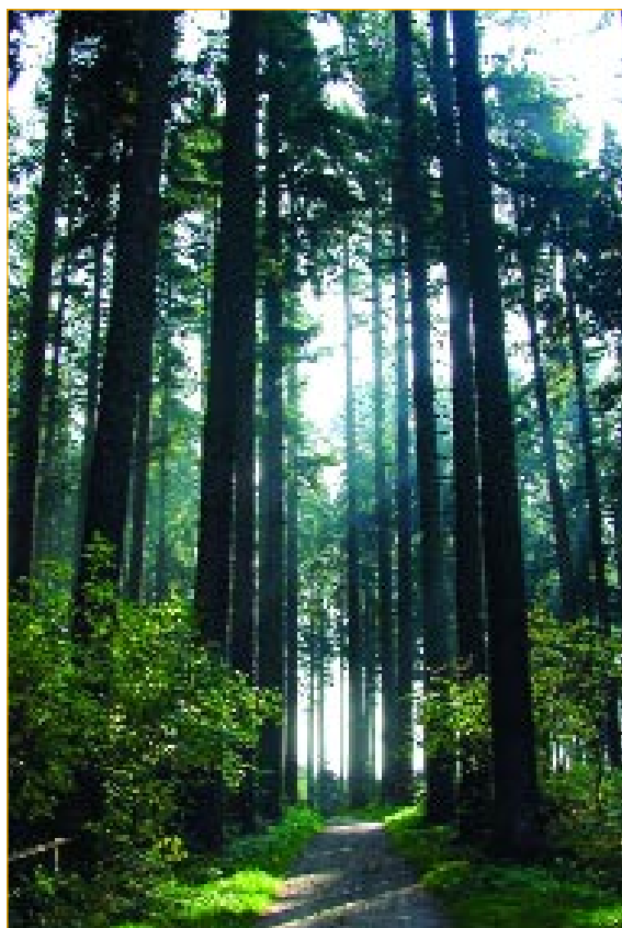
Plantation de douglas

(*) : On ne trouve pas le pin laricio de Corse au-dessus de 1 800 m (Rameau et al., 1989). Par conséquent, les régions de provenance sont limitées à 1 800 m d'altitude.