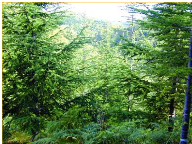
Cédraie de Rialsesse (Aude)