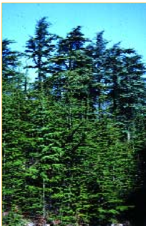
Cèdres de l'Atlas du Mont-Ventoux (Vaucluse)