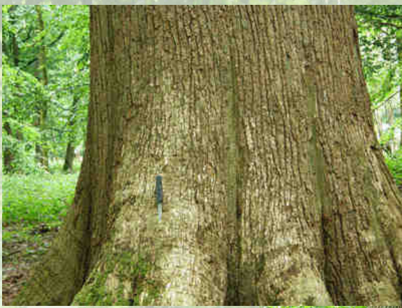
Des chênes de 450 et 550 ans !