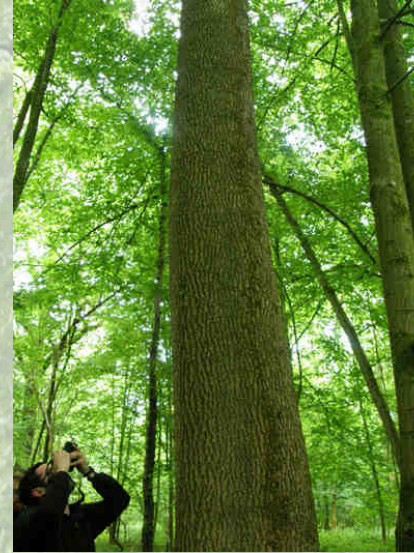
Des billes de frêne et d'érable superbes !