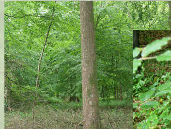
Aulnes et érables sycomores se côtoient sur l'ensemble de la forêt