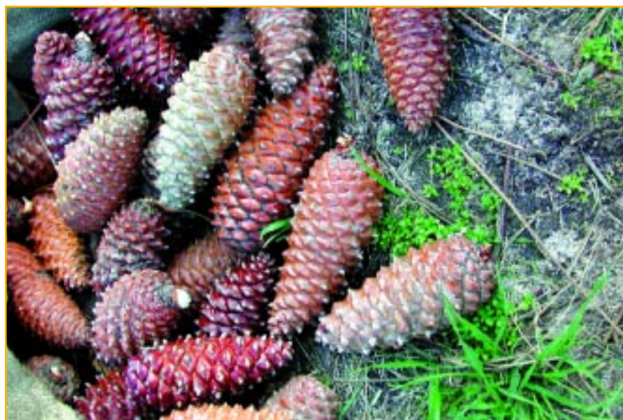
Cônes de Pin maritime

(*) : Le pin de Salzmann est présent jusqu'à 1 200 m d'altitude (Tanghe, 1991), la région de provenance est donc limitée à 1 200 m d'altitude. Aucun peuplement n'a encore été sélectionné au moment de l'édition de cette fiche, en raison d'incertitudes sur la pureté des peuplements proposés.